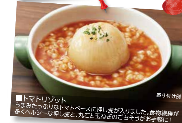
■トマトリゾット うまみたっぷりのトマトベースに押し麦が入りました。食物繊維が多くヘルシーな押し麦と、丸ごと玉ねぎのごちそうが手軽に!