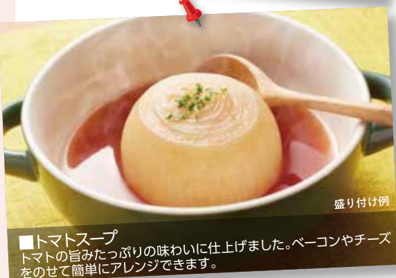
■トマトスープ トマトの旨みたっぷりの味わいに仕上げました。ベーコンやチーズをのせて簡単にアレンジできます。