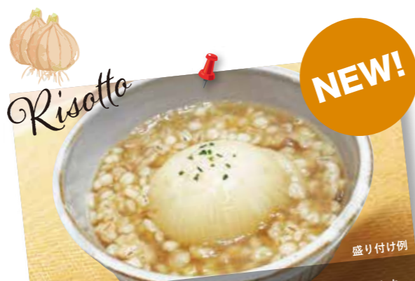
■押し麦リゾット 優しいコンソメベースに押し麦が入り、より満足感がアップしました。食物繊維が多くヘルシーな押し麦と、とろける玉ねぎの贅沢な一品!