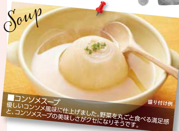
■コンソメスープ 優しいコンソメ風味に仕上げました。野菜を丸ごと食べる満足感と、コンソメスープの美味しさがクセになりそうです。